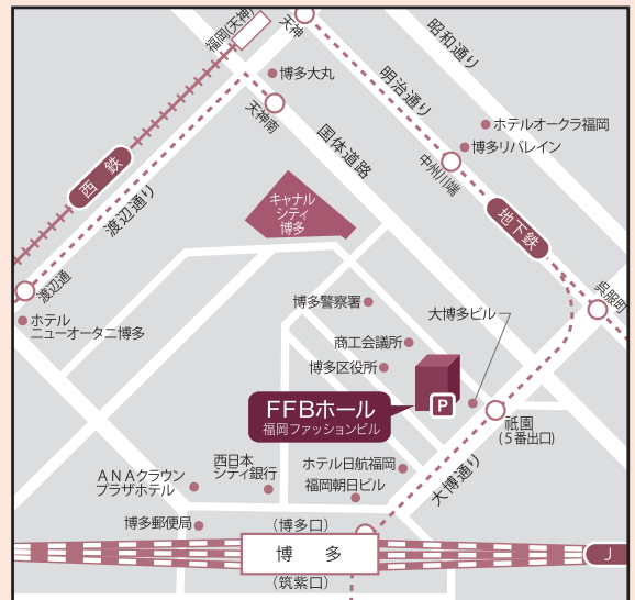
〈福岡会場〉FFB HALL 福岡ファッションビル JR「博多駅」博多口、地下鉄「祇園駅」5番出口