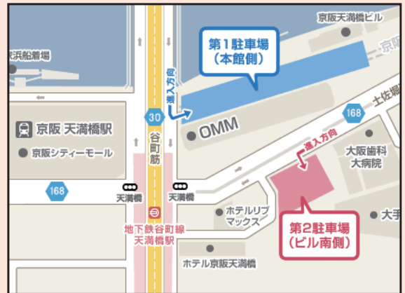
〈大阪会場〉大阪マーチャндаイズマート 京阪電車「天満橋駅」東口、地下鉄谷町線「天満橋駅」北改札口