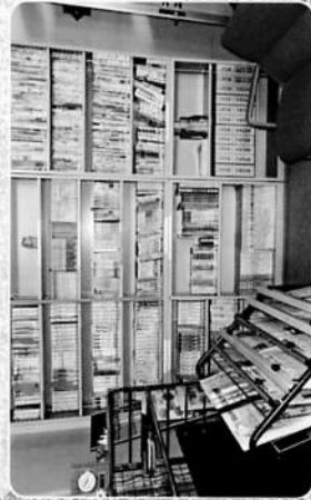
書籍・ビデオ・DVDコーナー